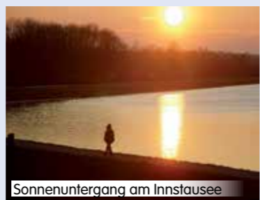
Sonnenergang am Innstausee